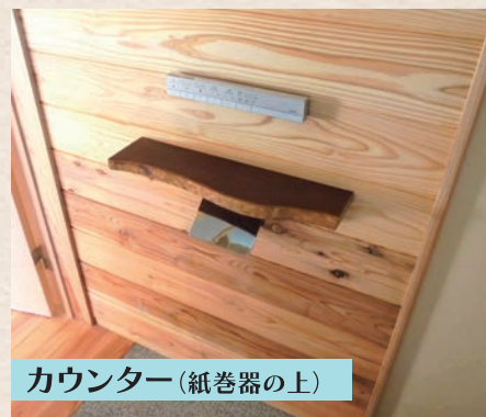
カウンター(紙巻器の上)

トイレの立ちすわりにふと手を掛けてしまうカウンターも前の住まいでなじんだ板を再利用