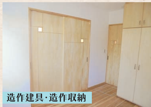
造作建具・造作収納

手刻みでなければ出来ない仕口を、各所に用いています。梁の下端に埋め込まれたダクト式照明は、スッキリと納められています。