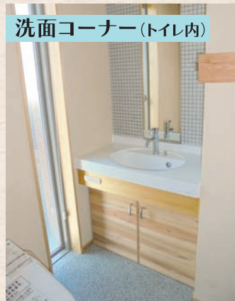
洗面コーナー(トイレ内)