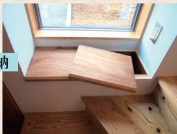
階段横ベンチ下収納

ベンチに座って夫婦団らのリビング。障子の淡い光が優しく包みゆったりと過ごせます。